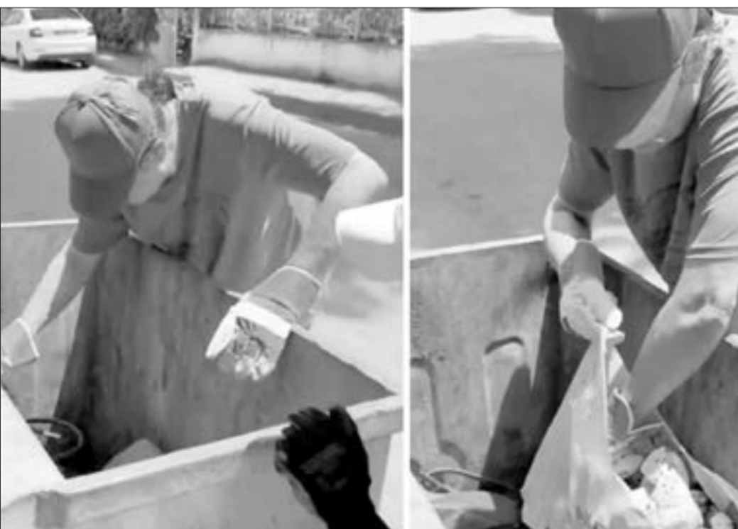
Məşhur müğənni Çelik zibil qabından kağız yığır