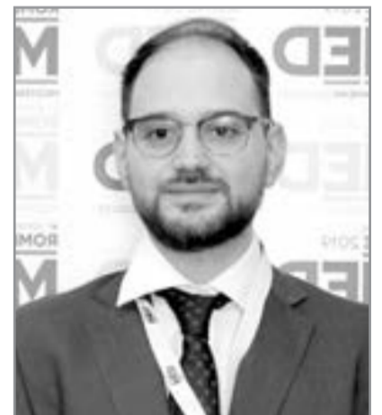
Domeniko Letitsiya, italyalı siyasətçi

“ Azərbaycanın azad edilmiş əraziləri innovativ şəhərsalma laboratoriyasına çevrilir ”