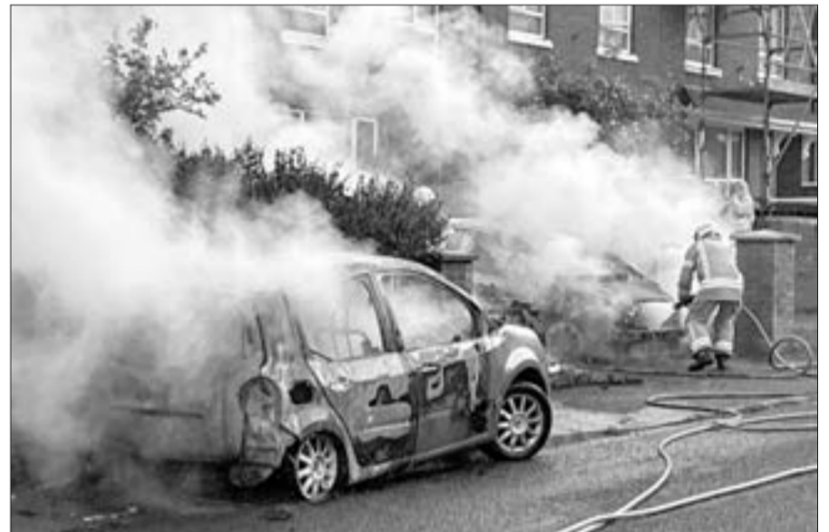
Şimali İrlandiyanın paytaxtı Belfastda iğtişaşlar