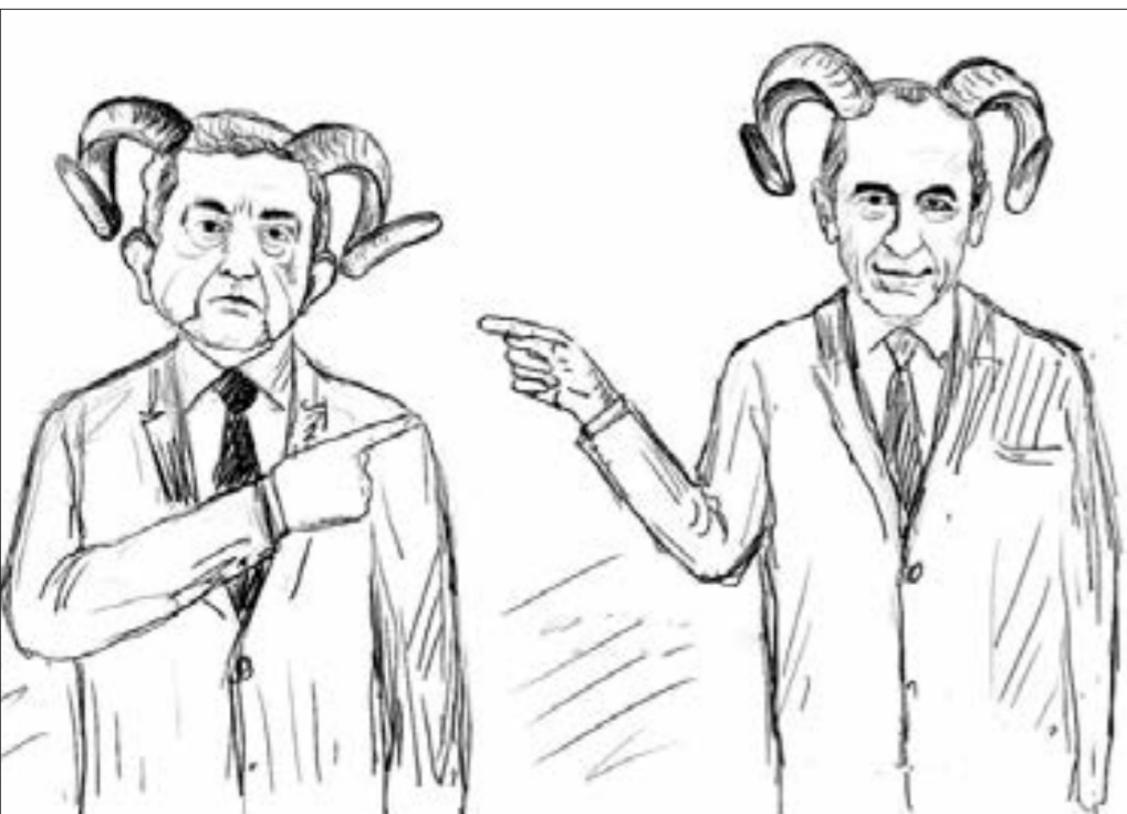
Revanşistlər seçkidən sonra